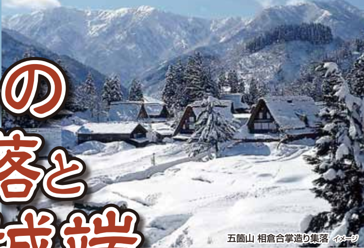
五箇山 相倉合掌造り集落 イメージ